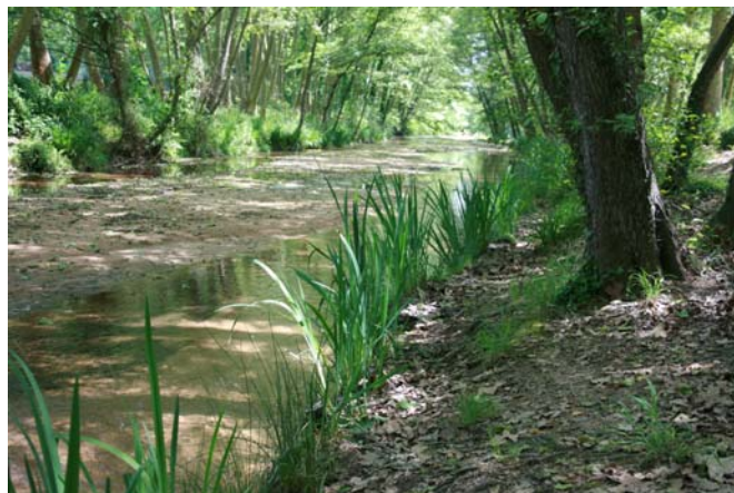
Imatges dels Fiber rolls™ al marge de la riera (Maig 09)