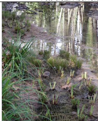
Foto dreta: Fiber rolls™ instal·lats als marges de la sortida d'un drenatge.