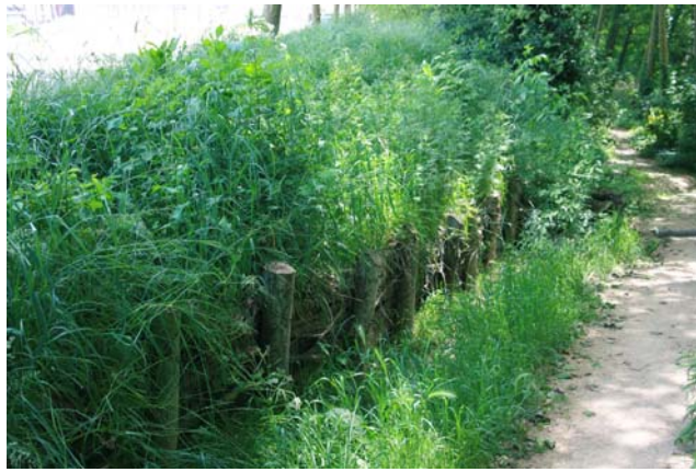
Feixina de branca seca com a protecció de la rampa d'accés a la riera