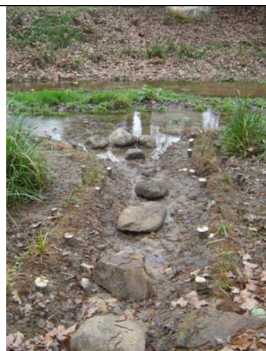
Foto esquerra: Plant plugs™ instal·lats al peu d'una estructura d'enginyeria naturalística tipus Entramat .