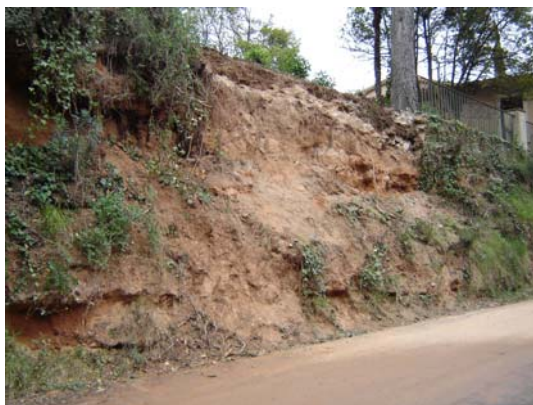
Imatge del marge abans de l'inici de l'obra