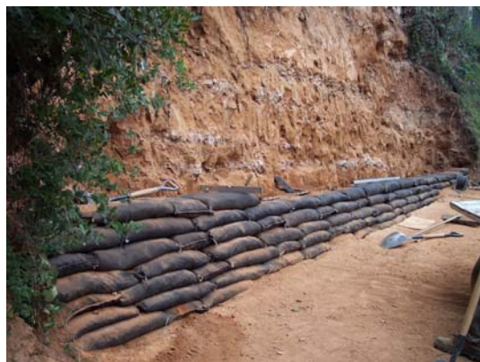
Diferents detalls del procés constructiu