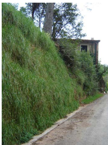
Imatge del mur a l'octubre de 2006