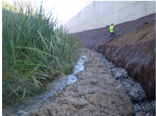
Imágenes de los trabajos en el margen derecho, donde se repite la actuación ejecutada en el margen izquierdo.