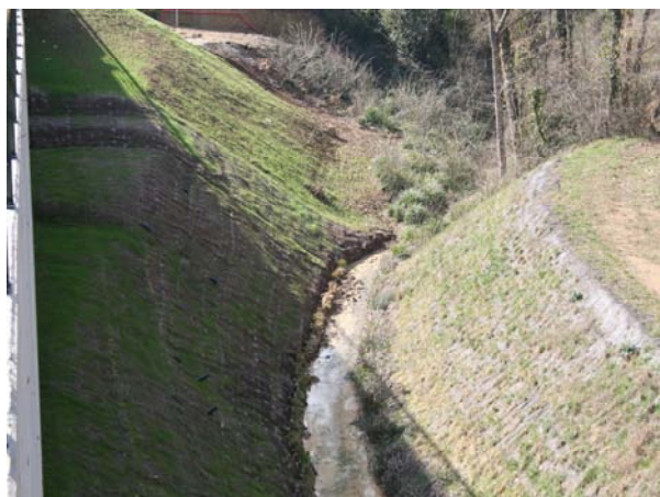
Vista general dos semanas después de la finalización de los trabajos en el margen derecho.