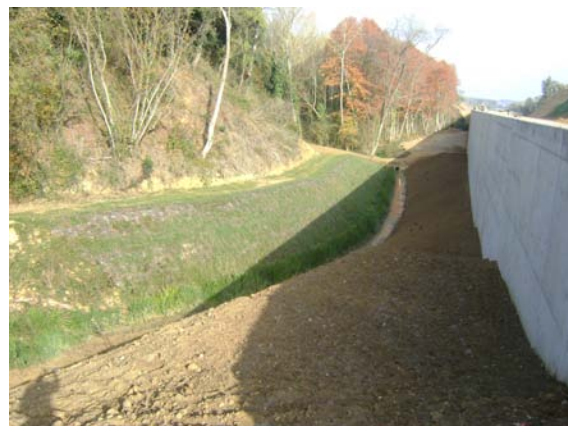
En la última fotografía el aspecto 6 meses después de la actuación, donde se puede apreciar que aún no habían comenzado los trabajos del margen derecho.