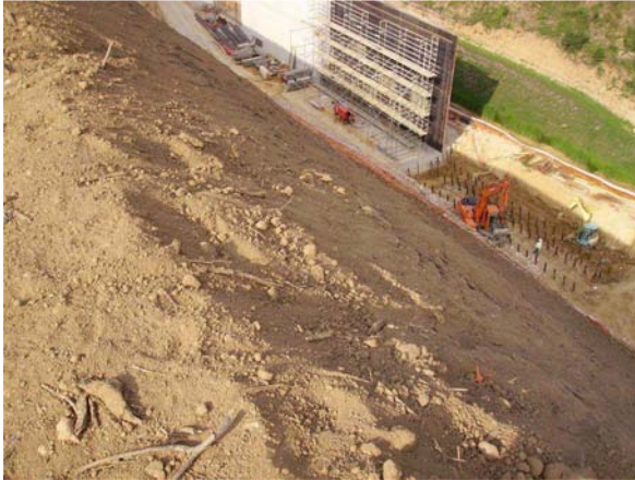
Imagen de la construcción del muro de contención de la traza de la LAV. Al otro lado del muro se aprecia el margen izquierdo ya vegetado.