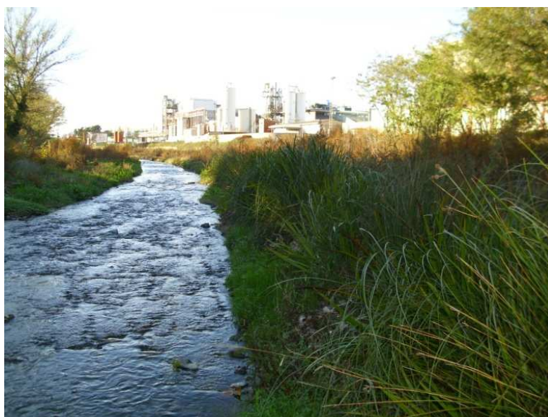
Imágenes de la instalación del Fiber Roll™ vegetalizado en Enero de 2010, y 10 meses después.