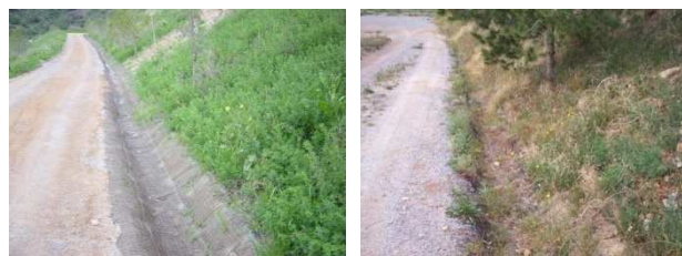
Cunetas con geomalla permanente C350 Vmax