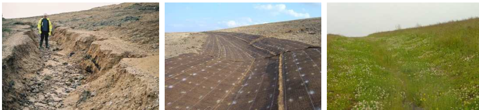
Canal de drenaje con geomalla permanente C350 Vmax